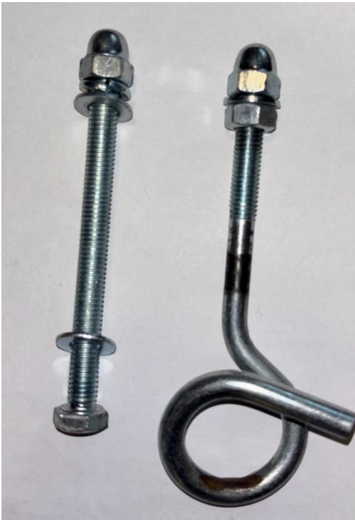
2. szériás állvány